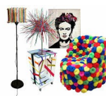
Arte del riciclo