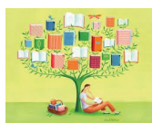
Libri, fumetti, cartoline,