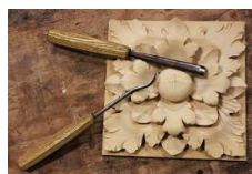
Artisti del legno